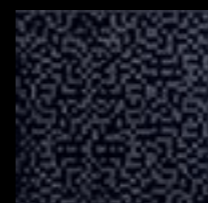
G25089 特 250x250mm