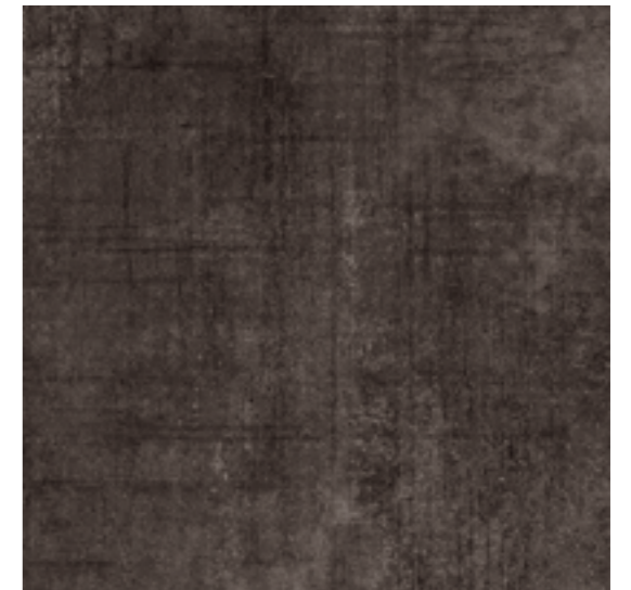
HD66RH591 特特 600x600mm