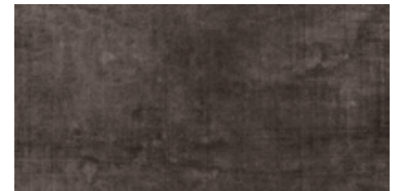
HD36RH591 特特 299x600mm