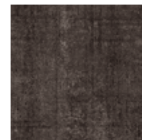
HD30RH591 特特 299x299mm